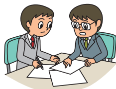
売上高減少の防止・軽減 営業継続費用